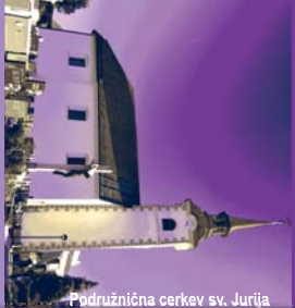
Podružnična cerkev sv. Jurija

BOLJ KO SI POVEZAN Z JEZUSOM, KI POSTANE SREDIŠČE TVOJEGA ŽIVLJENJA, BOLJ TI POMAGA, DA POZABLJAŠ NASE IN SE ODPREŠ DRUGIM. papež Frančišek