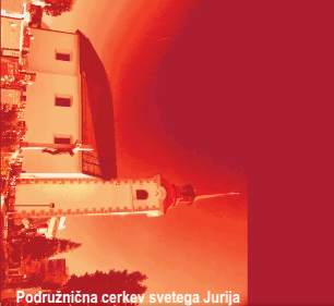
Podružnična cerkev svetega Jurija