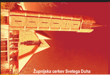
Župnijska cerkev Svetega Duha

Uradne ure: Ponedeljek, sreda: 18.15-18.45; petek: 18h-18.30 ali po dogovoru.