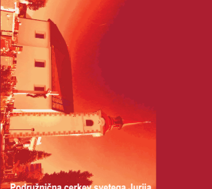
Podružnična cerkev svetega Jurija