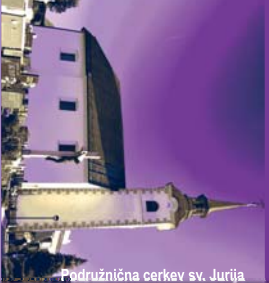
Podružnična cerkev sv. Jurija