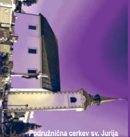
Podružnična cerkev sv. Jurija