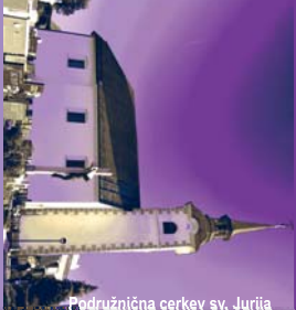
Podružnična cerkev sv. Jurija