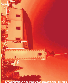
Podružnična cerkev svetega Jurija