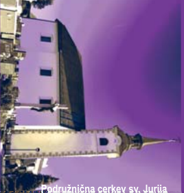
Podružnična cerkev sv. Jurija