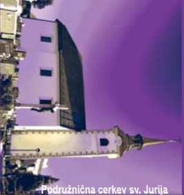
Podružnična cerkev sv. Jurija