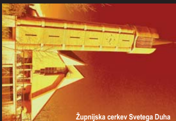
Župnijska cerkev Svetega Duha

Uradne ure v septembru: Ponedeljek, sreda: 18.15–18.45 in petek: 18h–18.30 ali po dogovoru.