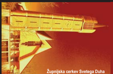
Župnijska cerkev Svetega Duha