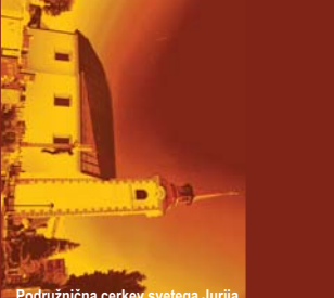
Podružnična cerkev svetega Jurija