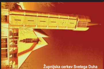
Župnijska cerkev Svetega Duha

Uradne ure v septembru: Pon., sre.: 18.15-18.45 in pet.: 18h-18.30 ali po dogovoru.