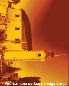
Podružnična cerkev svetega Jurija

ČLOVEK OSTANE ČLOVEK DO SODNEGA DNE. NAĐ ČLOVEŠTVOM PA VEJE BOŽJI DUH IN SNUJE BOŽJA MISEL. NA NAŠE DRZNO VPRAŠANJE: »ZAKAJ TAKO IN NE DRUGAČEJ?« BO ODGOVORILA VEČNOST.