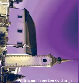
Podružnična cerkev sv. Jurija