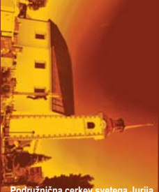
Podružnična cerkev svetega Jurija