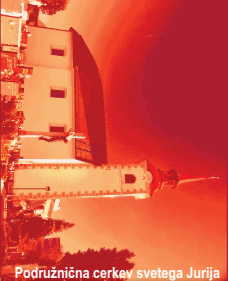
Podružnična cerkev svetega Jurija