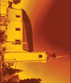
Podružnična cerkev svetega Jurija