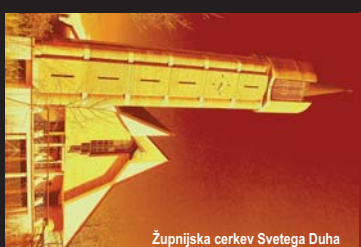
Župnijska cerkev Svetega Duha

Uradne ure: ponedeljek, sreda: 17.15–17.45; petek: 17h-17.30 ali po dogovoru.