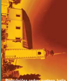
Podružnica cerkev svetega Jurija

ČE HOČEŠ RESNIČNO LUBITI IN POSTATI SREČEN, MORASH SKRBE TI ZA LJUDI, KI SO TI BLIZU, KI SO ZAUPANI TVOJI SKRBI, S KATERIMI BIVAS, GOVORIS IN SE SMEJES. Phil Bosmans