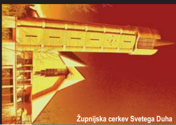
Župnijska cerkev Svetega Duha

Uradne ure v avgustu: Ponedeljek, sreda, petek po večerni maši ali po dogovoru.