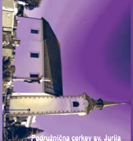
Podružična cerkev sv. Jurija

NE UKVARJATE SE PREVEČ S POTJO, NA KATERO VAS JE POSTAVIL GOSPOD, RAJE VES ČAS UPIRAJTE POGLEDE VANJ, KI VAS VODI, IN V NEBEŠKO DOMOVINO, V KATERO VAS ŽELI PRIPELJATI.