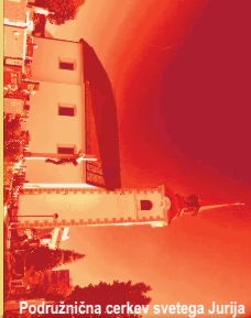
Podružnična cerkev svetega Jurija